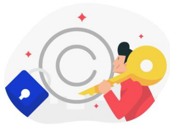
1 – droit d’auteur