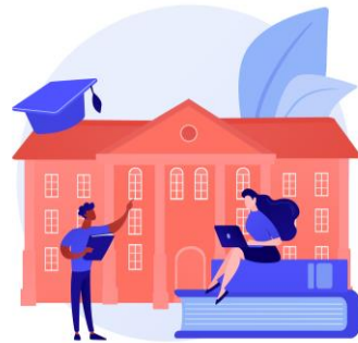
6 – savoir-faire établissement