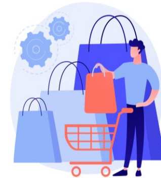
8 - marchandisation