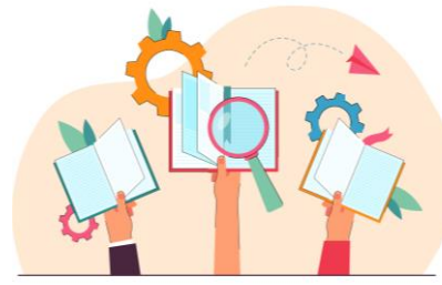
3 - partage