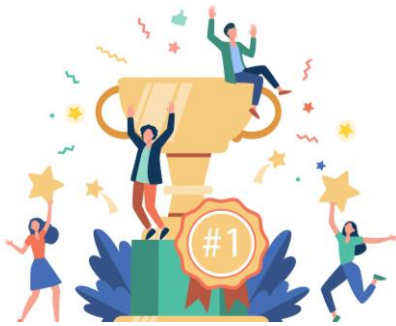
5 - reconnaissance