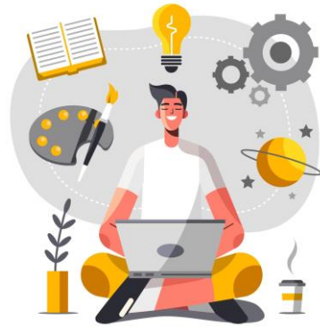
2 - créativité