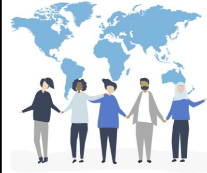
4 - coopération